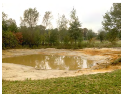
NIEUW AANGELEGDE POEL WAARBIJ DE TOPLAAG OP DE OEVER IS VERWIJDERD

Leg de poel aan op zeker 10 – 20 meter afstand van hoge beplanting. Dat voorkomt bladval en daarmee onnodig vaak onderhoud van de poel. Een plek in de zon is juist heel gunstig.