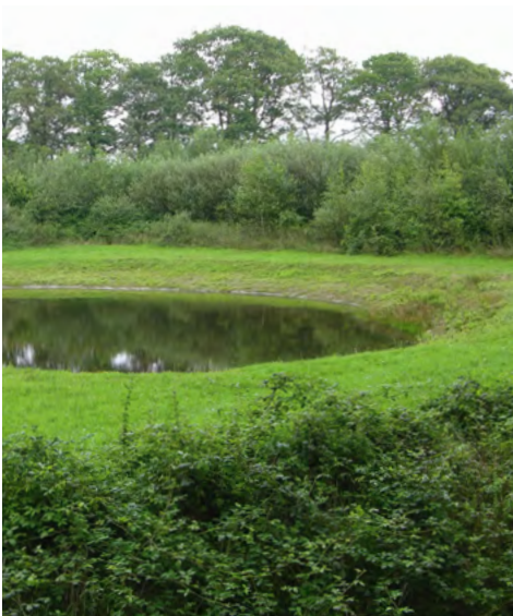
EEN OPTIMALE POEL MET BEGROEIING IN DE DIRECTE OMGEVING