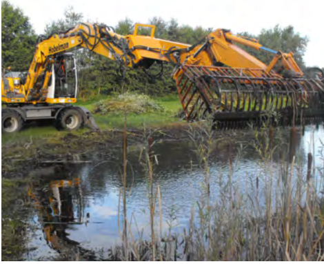
HET SCHONEN VAN DE HELFT VAN DE POEL