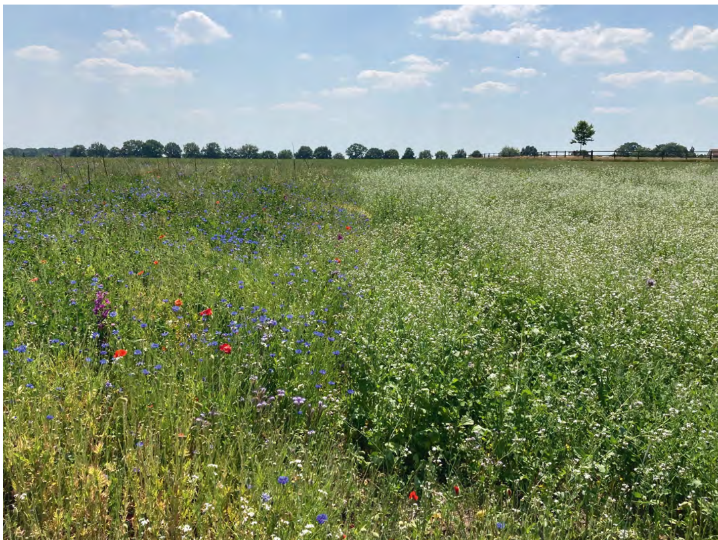
EEN KRUIDENRIJKE AKKERRAND DIE VOOR DE HELFT OPNIEUW IS INGEZAAID