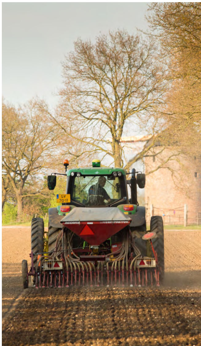
INZAAIEN VAN EEN NIEUWE KRUIDENRIJKE AKKERRAND