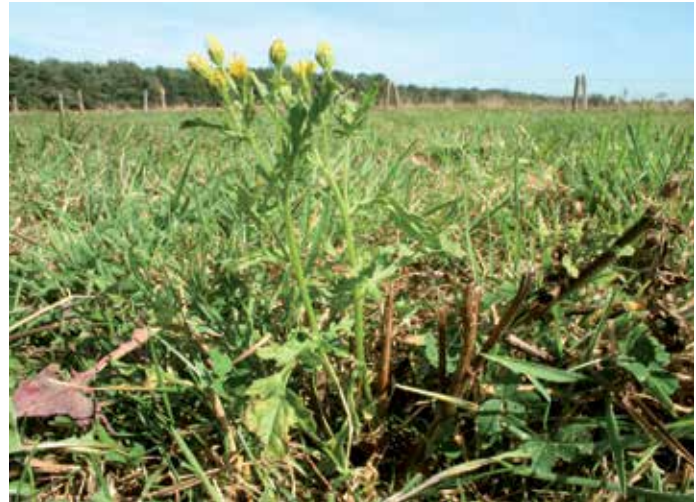
Bij te vroeg maaien kan de plant binnen enkele dagen opnieuw bloeien.

Als de bloemen van de helft van de planten er uit ziet als op de foto links is maaien precies op tijd, op de foto rechts is het net te laat. Goede timing van het maaien kan tot 87% afname van het Jacobskruiskruid leiden.