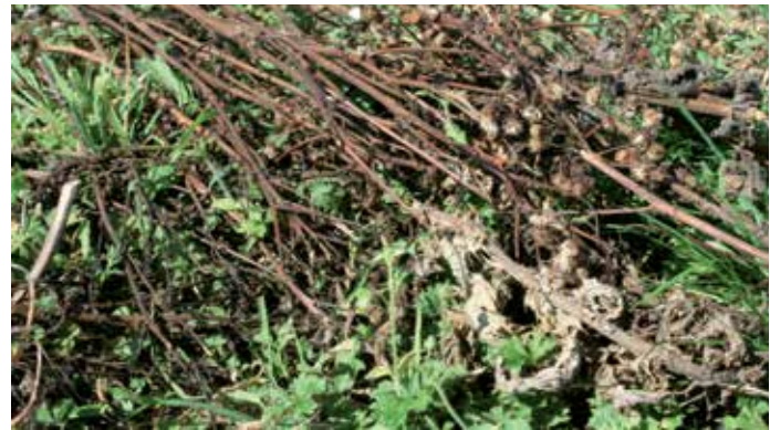
Bij te laat maaien kan het zaad in de bloemknoppen alsnog afrijpen.